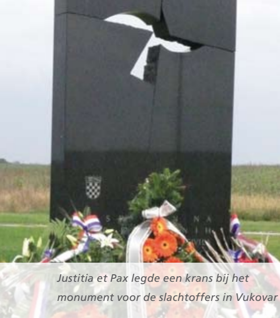
Justitia et Pax legde een krans bij het monument voor de slachtoffers in Vukovar